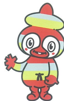
本部町のゆるキャラ ブトモー